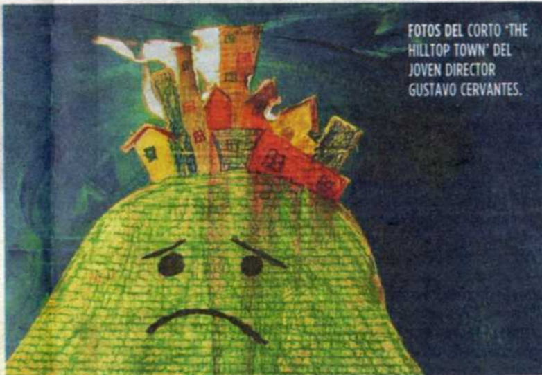
FOTOS DEL CORTO 'THE HILLTOP TOWN' DEL JOVEN DIRECTOR GUSTAVO CERVANTES.

Festival de cortos cinematográficos 'Optic Nerve XI', mañana a las 7 y 9 p.m., en el Museo de Arte Contemporáneo (MOCA), 770 NW 125 St. Reservas: (305) 893-6211.